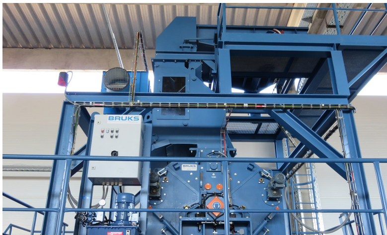
Молотковая мельница с блоком подачи

** только молотковая мельница без мотора, сепаратора камней и металла, системы подачи материала и т. д.