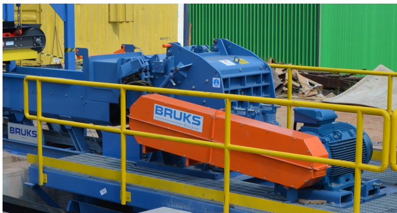
Rotom-rivare med matar enhet