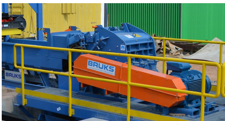
Rotom Hammer Hog mit Einzugsseinheit